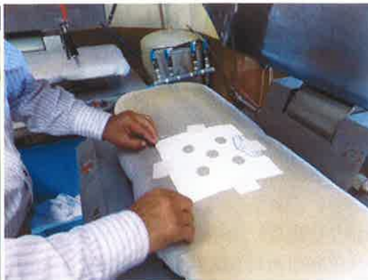
すぐに綿プレスやアイロンを使って固定する