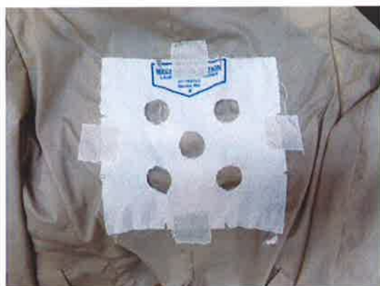
試験が終了したら糸を切って取り外す